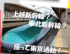
上越新幹線? 東北新幹線?