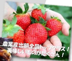
農業産出額全国トップクラス! 美味しいものがたくさん!